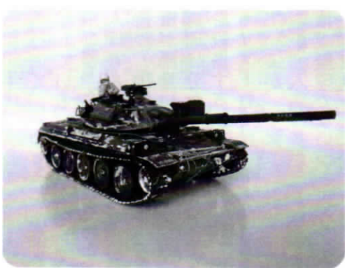
陸上自衛隊 74式戦車

90式、10式を完成させた。戦車の移動は一般道路では困難で、トラック、列車や船舶が必要で即戦力になれない。16式機動戦闘車は8輪駆動で時速100キロ、105ミリ砲、25ミリ機銃の武装で、重量26トン、高速道を100キロで移動できるといふ。タミヤの1/35で組み上げたが、足回りが難しかった。兵員、武器や装備品なども別売されており、これらを組み合わせると真実味がましてくる。世界の政治、経済情勢は厳しく、