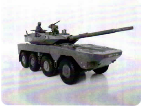
陸上自衛隊 16式機動戦闘車

大学生の頃からプラモデルを作っていた。数年前からは自衛隊の戦闘車シリーズにしている。いかに本物らしく似せるかが勝負だ。自衛隊関係の雑誌を読んだり、富士山麓での総火演も見学してきた。プラモデル屋には専用の道具類、塗料や筆があり、仕上げる事自体が楽しい。戦後の戦車、61式、74式、