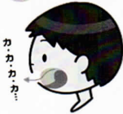
カ 口蓋の奥に舌の付け根付近をつける