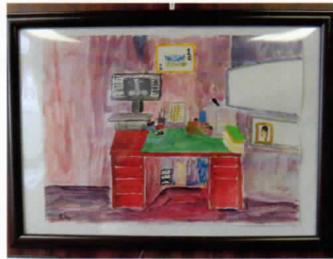
『診察室』 作・院長先生 (東階段踊り場)